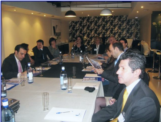
Los asistentes durante la presentación de la solución

El pasado día 25 de marzo, Vmark™ con la colaboración de IBM convocó una jornada informativa sobre la solución FAST BACK TIVOLI de IBM en el original espacio COCINA CAYENA en Madrid.