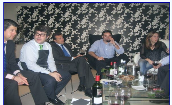
Probando los conocimientos adquiridos

Tras las presentaciones, todos los asistentes se pusieron manos a la obra y aprovechando las excelentes instalaciones que ofrecía el espacio