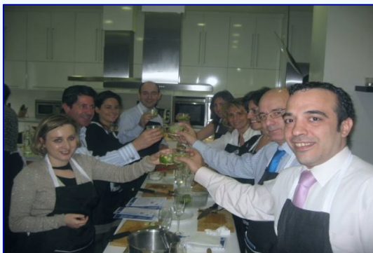
Un brindis por el trabajo bien hecho

elegido, aprendieron a cocinar varios de los extraordinarios platos que luego se pudieron degustar como parte del almuerzo ofrecido como colofón a las presentaciones.